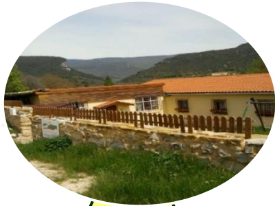
CORNEJO Albergue de Cornejo