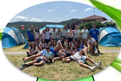
FRIAS Acampada en Frias Aventura